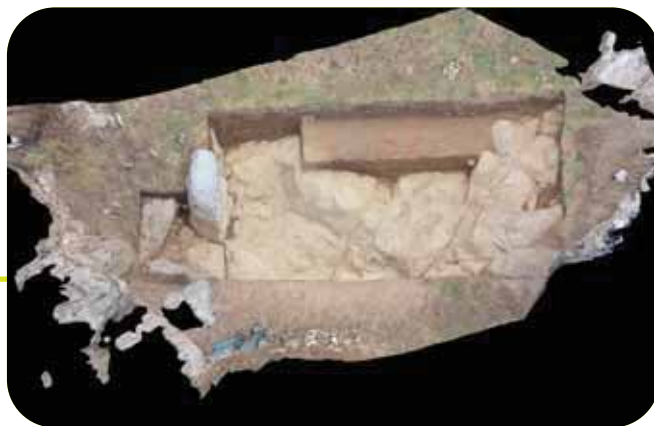
Image du fossé retravaillée en modélisation

La campagne de fouille avait pour objectif de retrouver les limites du château. Ces dernières sont symbolisées au sud et au nord par les gorges formant des remparts naturels. A l'ouest, une voie pavée de 15 mètres de long identifie un des points d'accès vers le site. Cet ouvrage monumental laisse supposer que les seigneurs du lieu disposaient d'importantes ressources en hommes et en argent. A l'est, c'est un fossé qui a été mis au jour. Il s'agit d'un ouvrage de défense passive qui est symbolisé par une faille courant d'une gorge à l'autre, créant ainsi une fracture entre le plateau qui remonte vers Monistrol et l'éperon où se situe le château.