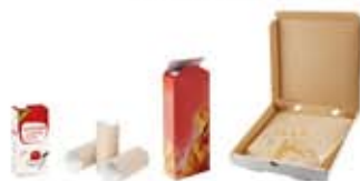
EMBALLAGES EN PAPIER ET CARTON