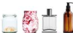
POTS, BOCAUX ET FLACONS EN VERRE