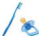
OBJETS EN PLASTIQUE