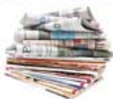
JOURNAUX ET MAGAZINES